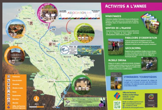
Set de table