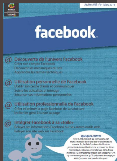
Programme d'un atelier numérique