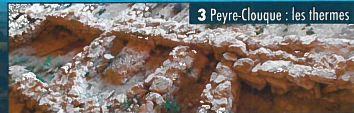
3 Peyre-Clouque : les thermes