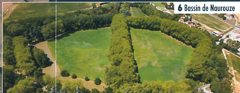
6 Bassin de Naurouze