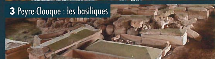
3 Peyre-Clouque : les basiliques