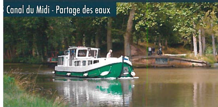
Canal du Midi - Partage des eaux