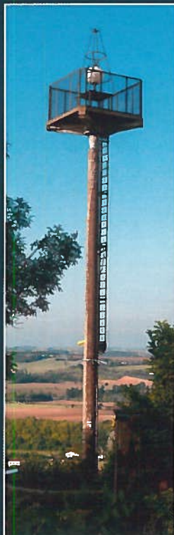
2 Phare aéronautique