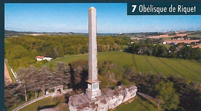
7 Obélisque de Riquet