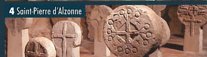
4 Saint-Pierre d'Alzonne